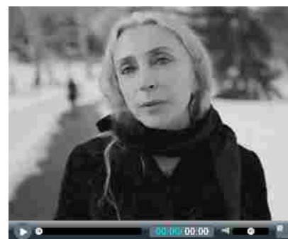
Franca Sozzani, la sua storia al cinema. Il trailer