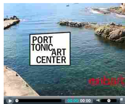
Port Tonic Art Center, St. Tropez